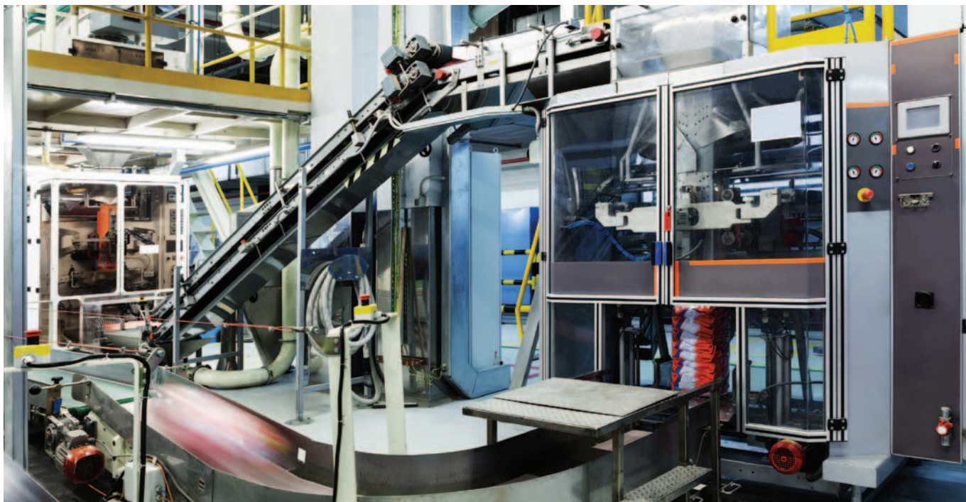
Оптимизированная продукция для увеличения объема производства с меньшим объемом технических работ