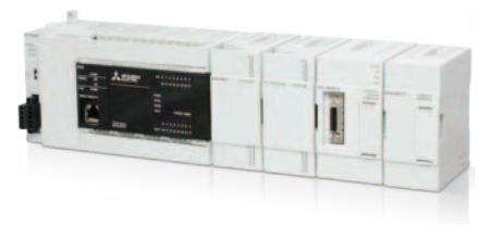
Дополнительные модули для ваших задач

Реальное положение серводвигателя можно определить путем регистрации меток, отпечатанных на пленке, движущейся на высокой скорости. Компенсация позиции оси резака на основе регистрации меток сохраняет постоянное положение резки.