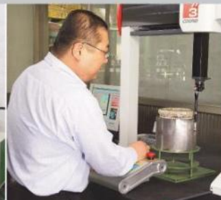
三次元測量 CMM Measurement