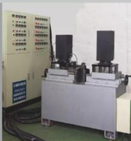
跑台台測試 Running-Test Machine