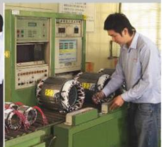
定子3Q檢測 Hi-pot test