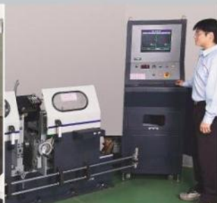
精密校正 High-speed Balance Equipment